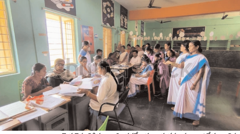
మెరుగైన చికిత్స అందించడమే ఈ కార్యక్రమ ముఖ్య ఉద్దేశ్యం. చిన్న వయసులోనే వ్యాధులను గుర్తించడం ద్వారా విద్యార్థుల మరణాలను అరికట్టవచ్చని అధికారులు భావిస్తున్నారు. ఈ నిర్ణయంపై విద్యార్థుల తల్లిదండ్రులు హర్షం వ్యక్తం చేస్తున్నారు.

విజయవాడ ఏప్రిల్ 15 (నేటి మనదేశం ప్రతినిధి) : రాష్ట్రంలోని గురుకులాలు, ఆశ్రమ పాఠశాలల్లో విద్యనభ్యసించే విద్యార్థుల ఆరోగ్యంపై ఏపీ ప్రభుత్వం ప్రత్యేక దృష్టి సారించింది. విద్యార్థుల సంక్షేమమే ధ్యేయంగా మంగళగిరి ఎయిమ్స్ (కాఎమ్సీ) వైద్యుల సహకారంతో 11 రకాల కీలక వైద్య పరీక్షలు నిర్వహించేందుకు శ్రీకారం చుట్టింది. తొలుత పైలట్ ప్రాజెక్టుగా అల్లూరి సీతారామరాజు జిల్లాలో ఈ కార్యక్రమాన్ని ప్రారంభించి, ఆనంతరం దశలవారీగా రాష్ట్రవ్యాప్తంగా విస్తరించనున్నారు. ఈ పరీక్షల్లో భాగంగా గుండె, జన్యు, మెటబాలిక్, రక్త సంబంధిత వ్యాధులతో పాటు పోషకాహార స్థితిని కూడా వైద్యులు అంచనా వేస్తారు. పరీక్షల ఆనంతరం ప్రతి విద్యార్థికి ప్రత్యేకంగా 'హెల్త్ ప్రొఫైల్' రూపొందించి డేటా బేస్లో భద్రపరుస్తారు. గిరిజన ప్రాంతాల్లో విద్యార్థులు ఎదుర్కొంటున్న రక్తహీనత, జన్యుపరమైన సమస్యలను ప్రాథమిక దశలోనే గుర్తించి