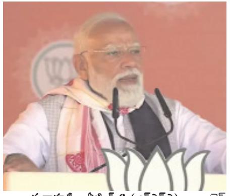
గువాహటి, ఏప్రిల్ 6 (ఆర్ఎన్ఎ): కాంగ్రెస్ పార్టీ పాకిస్తాన్తో సంబంధాలు నెరుపుతున్నట్లు దేశ ప్రధాని మోదీ తీవ్ర విమర్శలు గుప్పించారు.

అస్సాంలో జరిగిన ఎలక్షన్ ర్యాలీలో పాల్గొన్న మోదీ దేశ భద్రతపై ప్రతిపక్షం వ్యవహరిస్తోన్న తీరుకు ఇప్పటికే పలుమార్లు ఛార్జీ మూల్యం చెల్లించుకోవాల్సి వచ్చిందని విమర్శించారు. "సిందూర్ సమయంలో కూడా కాంగ్రెస్ పాక్ పాట పాడింది. ఈ సంబంధం ఇప్పటికీ కాదు.. ఎప్పటి నుంచో సాగుతోంది. ఇది జాతీయ భద్రతను తీవ్రంగా దెబ్బతీస్తోంది" అని మోదీ పేర్కొన్నారు. "నిన్ను పవన్ ఖేరా, గౌరవ్ గోగాయ్ దిల్లీలో, గువాహటిలో రెండు ప్రెస్ కాన్ఫరెన్సులు నిర్వహించారు. అయితే ఆ కాన్ఫరెన్సుకి సంబంధించిన మొత్తం సమాచారాన్ని పాక్ సామాజిక మాధ్యమాల నుంచి తీసుకున్నట్లు గుర్తించాం. అస్సాం ఎన్నికలను ప్రభావితం చేసేందుకు ప్రయత్నాలు జరుగుతున్నాయి. రాష్ట్రంలో మిగతా 2లో..