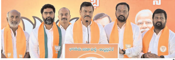
విజయవాడ, ఏప్రిల్ 6 (నేటి మనదేశం ప్రతినిధి): ఏపీ వ్యాప్తంగా బీజేపీ 47వ ఆవిర్భావ దినోత్సవ వేడుకలు ఘనంగా నిర్వహించారు. రాష్ట్ర వ్యాప్తంగా ఊరూ వాడా పార్టీ శ్రేణులు సంబరాలు చేపట్టారు. విజయవాడలోని బీజేపీ రాష్ట్ర మిగతా 2లో..