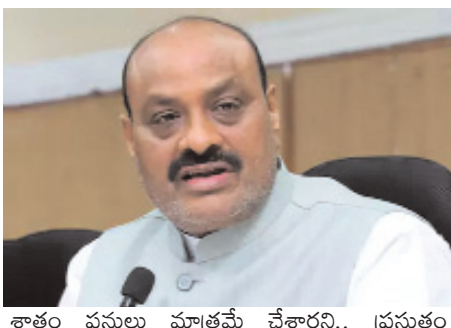
శాతం పనులు మాత్రమే చేశారని.. ప్రస్తుతం 70.54 శాతం పనులు పూర్తయినట్లు మంత్రి తెలిపారు. 20 నెలల్లోనే 49.63 శాతం ప్రాజెక్ట్ పనులు పూర్తి అయినట్లు మిగతా 2లో..

శ్రీకాకుళం, ఏప్రిల్ 6 (నేటి మనదేశం ప్రతినిధి): శ్రీకాకుళం జిల్లా వాసుల చిరకాల ఆకాంక్ష మూలపేట పోర్టు అని మంత్రిలు బీసీ జనార్ధన్ రెడ్డి, అచ్యన్ నాయుడు అన్నారు. రూ.4,360 కోట్లతో పోర్టు నిర్మాణం చేపట్టామని.. 1,524 ఎకరాల్లో 4 బెర్లిల నిర్మాణం చేపడు తున్నట్లు చెప్పారు. మూలపేట పోర్టును ఈ సవంబర్ నాటికి పూర్తి చేయాలని లక్ష్యంగా పెట్టుకున్నామని వెల్లడించారు. మూలపేట పోర్టును మంత్రిలు బీసీ జనార్ధన్ రెడ్డి, అచ్యన్ నాయుడు సోమవారం పరిశీలించారు. ఈ సందర్భంగా మంత్రి జనార్ధన్ మాట్లాడుతూ.. మూలపేట పోర్టును పరిశీలించామని.. ప్రాజెక్ట్ నిర్మాణంపై సమీక్ష నిర్వహించామని తెలిపారు. గత ప్రభుత్వంలో 20