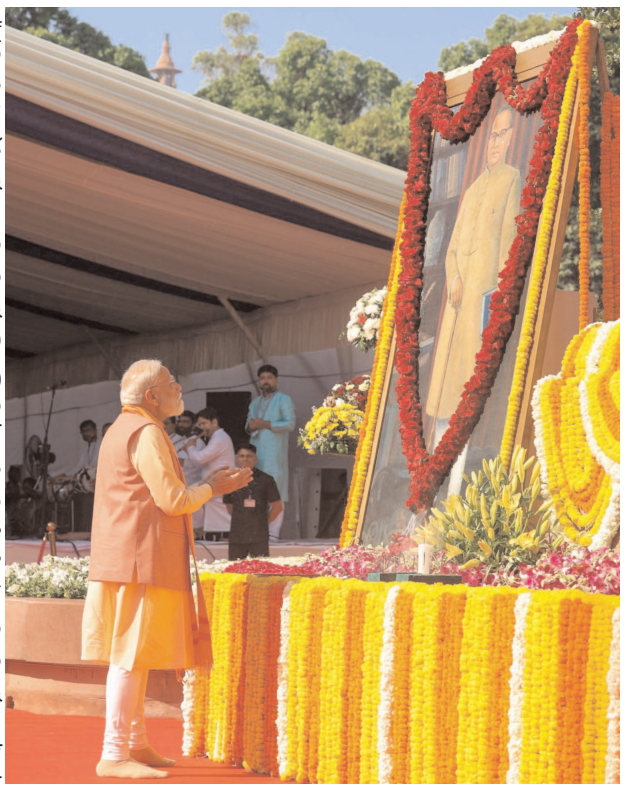
ముఖ్యమంత్రి కేసీఆర్ సహా వివిధ రాష్ట్ర ప్రముఖ నేతలు నివాళులు అర్పించారు. దేశం కోసం ఆయన చేసిన సేవలను స్మరించుకున్నారు. అలాగే అంబేద్కర్ వారులు వివిధ కార్యక్రమాలు నిర్వహిస్తూ ఆయణ్ణి గుర్తు చేసుకుంటున్నారు.

న్యూఢిల్లీ, ఏప్రిల్ 14 (ఆర్ఎన్ఎ): డాక్టర్ భీష్ం రాన్ రాంజీ అంబేద్కర్ 135వ జయంతి సందర్భంగా ప్రధాని నరేంద్ర మోడీ నివాళులు అర్పించారు. దేశ నిర్మాణంలో అంబేద్కర్ కృషి స్ఫూర్తిదాయకమని కొనియాడారు. న్యాయబద్ధమైన, ప్రగతిశీల సమాజాన్ని నిర్మించేందుకు బాబాసాహెబ్ జీవితం, కృషి తరతరాలకు స్ఫూర్తినిస్తున్నాయని ప్రశంసించారు. ఈ మేరకు ఎక్స్ వేదికగా ప్రధాని నరేంద్ర మోడీ స్పందించారు. 'డాక్టర్ బాబాసాహెబ్ అంబేద్కర్ జయంతి సందర్భంగా ఆయనకు ఘన నివాళులు. దేశ నిర్మాణ దిశగా ఆయన చేసిన కృషి ఎంతో ఒక న్యాయబద్ధమైన, ప్రగతిశీల సమాజాన్ని నిర్మించేందుకు ఆయన జీవితం, కృషి తరతరాలకు స్ఫూర్తినిస్తూనే ఉన్నాయి' అని ఢిల్లీలో చేశారు. మరోవైపు అంబేద్కర్ జయంతి సందర్భంగా దేశవ్యాప్తంగా పలువురు ప్రముఖులు నివాళులు అర్పించారు. ఏపీ సీఎం చంద్రబాబు, డిప్యూటీ సీఎం పవన్ కల్యాణ్, మంత్రి నారా లోకేశ్, తెలంగాణ సీఎం