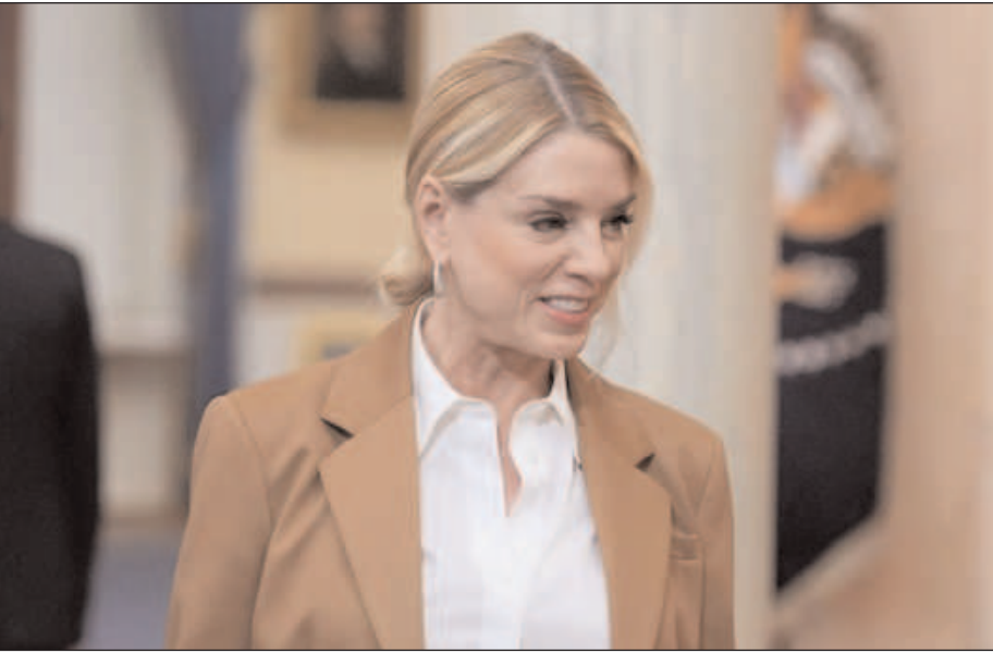
తన పదవి కాలంలో ట్రంప్ అజెండాకు గట్టి మద్దతుదారుగా నిలిచారు. న్యాయశాఖ తన

వాషింగ్టన్, ఏప్రిల్ 3 (ఆర్ఎన్ఎం): యుఎస్ అటార్నీ జనరల్ పామ్ బోండ్ ని ఆ పదవి నుండి ట్రంప్ యంత్రాంగం గురువారం తొలగించినట్లు వైట్ హౌస్ తెలిపింది. అంతర్జాతీయంగా వివాదాస్పదమైన లైంగిక నేరగాడు జెఫ్రీ ఎవ్స్టీన్ కు సంబంధించిన దర్యాప్తు పత్రాల నిర్వహణ సహా పలు అంశాలపై ట్రంప్ అసహనం వ్యక్తం చేసినట్లు సంబంధిత వర్గాలు పేర్కొన్నాయి. ముఖ్యంగా తాను దర్యాప్తు ఎదుర్కోవాలని కోరుకున్న విమర్శకులు, ప్రత్యర్థులపై అభియోగాలు మోపడంలో బోండ్ తగిన విధంగా వ్యవహరించకపోవడం ట్రంప్ ను తీవ్ర అసహనానికి గురిచేసినట్లు తెలిపాయి. పామ్ బోండ్ పదవి నుండి తొలగించబడిన రెండవ సీనియర్ అధికారి.