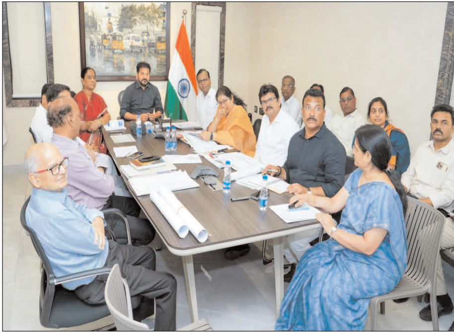
ఉన్నతాధికారులతో ముఖ్యమంత్రి రేవంత్ రెడ్డి ప్లాన్ను సీఎంకు అధికారులు వివరించారు. మాస్టర్ ప్లాన్పై అధికారులకు పలు సూచనలు చేశారు బాసర ఆలయ అభివృద్ధికి సంబంధించిన మాస్టర్ ప్లాన్. ఆలయ అభివృద్ధి అద్యుతంగా ఉండేలా

హైదరాబాద్, ఏప్రిల్ 5 (ఆర్ఎన్ఎ): బాసర ఆలయ అభివృద్ధిపై ప్రభుత్వం దృష్టి సారించింది. సీఎం రేవంత్ రెడ్డి ఈ నెల 6న బాసర సరస్వతి ఆలయం అభివృద్ధి పనులకు శంకుస్థాపన చేయనున్నారు. సుమారు రూ.225 కోట్ల వ్యయంతో ఆలయ అభివృద్ధి కార్యక్రమాలను ప్రారంభించనున్నట్లు ప్రభుత్వం తెలిపింది. బాసర ఆలయ అభివృద్ధికి సంబంధించి సమగ్ర మాస్టర్ ప్లాన్ ఇప్పటికే సిద్ధం కాగా, ఆలయాన్ని భవిష్యత్ అవసరాలకు అనుగుణంగా అభివృద్ధి చేయాలని సీఎం అధికారులకు ఆదేశాలు జారీ చేశారు. భక్తుల రద్దీని దృష్టిలో ఉంచుకుని విశాలమైన రహదారులు నిర్మించేలా చర్యలు తీసుకోవాలని సూచించారు. అలాగే ఆలయ పరిసరాల్లో పర్యావరణ పరిరక్షణ దృష్ట్యా ఈవీ వానానాలనే అనుమతించే విధంగా చర్యలు తీసుకోవాలని తెలిపారు. ఆలయ పవిత్రతకు భంగం కలగకుండా కఠిన నిబంధనలు అమలు చేయాలని స్పష్టం చేశారు. తిరుమల తిరుపతి దేవస్థానం తరహాలో ఆలయ పరిసరాల్లో ఎలాంటి రాజకీయ కార్యకలాపాలు జరగకుండా నియంత్రణలు ఉండాలని సీఎం పేర్కొన్నారు. భక్తులకు సౌకర్యాలు కల్పిస్తూ, ఆలయాన్ని అభివృద్ధి చేసే దిశగా అన్ని చర్యలు చేపట్టాలని అధికారులకు దిశానిర్దేశం చేశారు. బాసర ఆలయ అభివృద్ధిపై