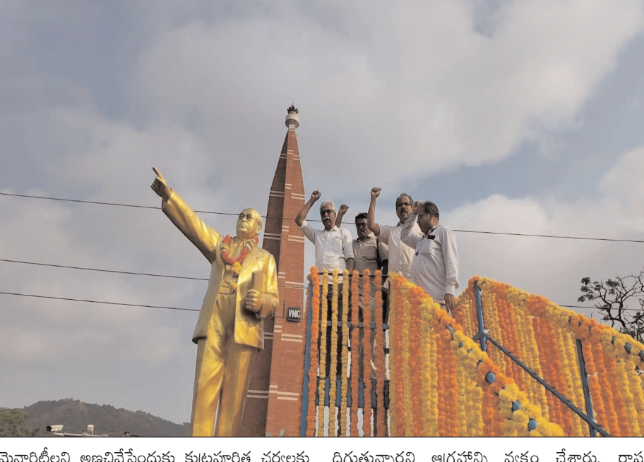
మైనారిటీలని అణచివేసేందుకు కుట్రపూరిత చర్యలకు దిగుతున్నారని అగ్రహాస్తి వ్యక్తం చేశారు. రాష్ట్ర