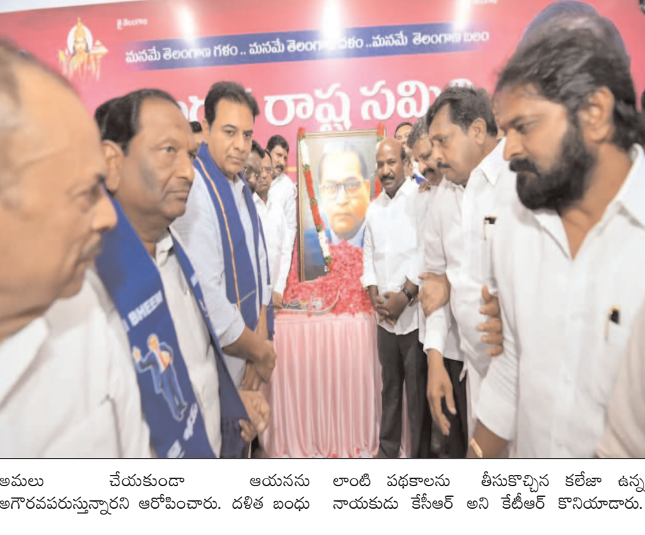
అమలు చేయకుండా ఆయనను లాంటి పథకాలను తీసుకొచ్చిన కలేజా ఉన్న అగౌరవపరుస్తున్నారని ఆరోపించారు. దళిత బంధు నాయకుడు కేసీఆర్ అని కేటిఆర్ కొనియాడారు.

హైదరాబాద్, ఏప్రిల్ 14 (ఆర్ఎన్ఎ): బీఆర్ఎస్ కార్యాలయంలో అంబేద్కర్ జయంతి వేడుకలు ఘనంగా నిర్వహించారు. ఈ సందర్భంగా మాజీ మంత్రి, బీఆర్ఎస్ వర్కింగ్ ప్రెసిడెంట్ కేటిఆర్ మాట్లాడుతూ.. పోరాడితే పోయేదేమీ లేదన్న శ్రీశ్రీ చెప్పిన మాట నిజం అయిందని.. ప్రపంచంలోనే అతిపెద్ద అంబేద్కర్ విగ్రహాన్ని కేసీఆర్ ఏర్పాటు చేశారని తెలిపారు. అయితే కాంగ్రెస్ ప్రభుత్వం 125 అడుగుల అంబేద్కర్ విగ్రహానికి సంక్షోభ వేసి బంధి చేసినదని ఆరోపించారు. ఈసారి బంధి చేస్తే సంతోషం బద్దలు కొడతామని పిలుపు ఇచ్చిన వెంటనే విగ్రహాన్ని ఓపెన్ చేశారని వ్యాఖ్యానించారు. అంబేద్కర్ తత్వం 'బోధించు, సమాకరించు, పోరాడు'తోనే కేసీఆర్ తెలంగాణ రాష్ట్రాన్ని సాధించారని కేటిఆర్ పేర్కొన్నారు. గురుకులాలను రేపంత్ రెడ్డి ప్రభుత్వం పట్టించుకోవడం లేదని విమర్శించారు. గురుకులాల్లో మరణ మృదంగం మోగుతోందని ఆవేదన వ్యక్తం చేశారు. కాంగ్రెస్ పార్టీ అంబేద్కర్ ను రాజకీయ అవసరాలకు మాత్రమే వాడుకుంటోంది తప్ప.. ఎన్నడూ నిజమైన గౌరవం ఇవ్వలేదని విమర్శించారు. కాంగ్రెస్ ప్రభుత్వం ఉన్నంత కాలం అంబేద్కర్ కు భారతరత్న ఇవ్వలేదన్నారు. అంబేద్కర్ అభయ హస్తం పథకాన్ని