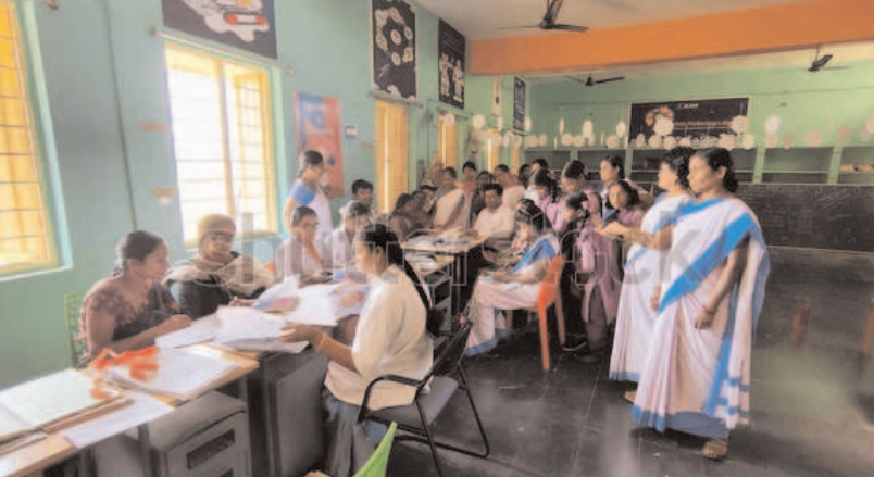
మెరుగైన చికిత్స అందించడమే ఈ కార్యక్రమ ముఖ్య ఉద్దేశ్యం. చిన్న వయసులోనే వ్యాధులను గుర్తించడం ద్వారా విద్యార్థుల మరణాలను అరికట్టవచ్చని అధికారులు భావిస్తున్నారు. ఈ నిర్ణయంపై విద్యార్థుల తల్లిదండ్రులు హర్షం వ్యక్తం చేస్తున్నారు.

విజయవాడ ఏప్రిల్ 15 (నేటి మనదేశం ప్రతినిధి) : రాష్ట్రంలోని గురుకులాలు, ఆశ్రమ పాఠశాలల్లో విద్యనభ్యసిస్తున్న విద్యార్థుల ఆరోగ్యంపై ఏపీ ప్రభుత్వం ప్రత్యేక దృష్టి సారించింది. విద్యార్థుల సంక్షేమమే ధ్యేయంగా మంగళగిరి ఎయిమ్స్ (ఐఆర్ఎమ్) వైద్యుల సహకారంతో 11 రకాల కీలక వైద్య పరీక్షలు నిర్వహించేందుకు శ్రీకారం చుట్టింది. తొలుత పైలట్ ప్రాజెక్టుగా అల్లూరి సీతారామరాజు జిల్లాలో ఈ కార్యక్రమాన్ని ప్రారంభించి, ఆనంతరం దశలవారీగా రాష్ట్రవ్యాప్తంగా విస్తరించనున్నారు. ఈ పరీక్షల్లో భాగంగా గుండె, జన్యు, మెటబాలిక్, రక్త సంబంధిత వ్యాధులతో పాటు పోషకాహార స్థితిని కూడా వైద్యులు అంచనా వేస్తారు. పరీక్షల ఆనంతరం ప్రతి విద్యార్థికి ప్రత్యేకంగా 'హెల్త్ ప్రొఫైల్' రూపొందించి డేటా బేస్లో భద్రపరుస్తారు. గిరిజన ప్రాంతాల్లో విద్యార్థులు ఎదుర్కొంటున్న రక్తపోత, జన్యుపరమైన సమస్యలను ప్రాథమిక దశలోనే గుర్తించి