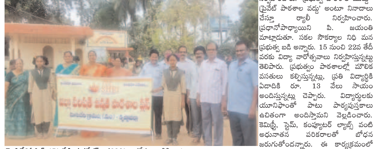
మోపిదేవి ఏప్రిల్ 15 (నేటి మనదేశం ప్రతినిధి) : 'నేస్తం బడికి రా' కార్యక్రమాన్ని జిల్లా పరిషత్ హై స్కూల్ విద్యార్థులు బుధవారం