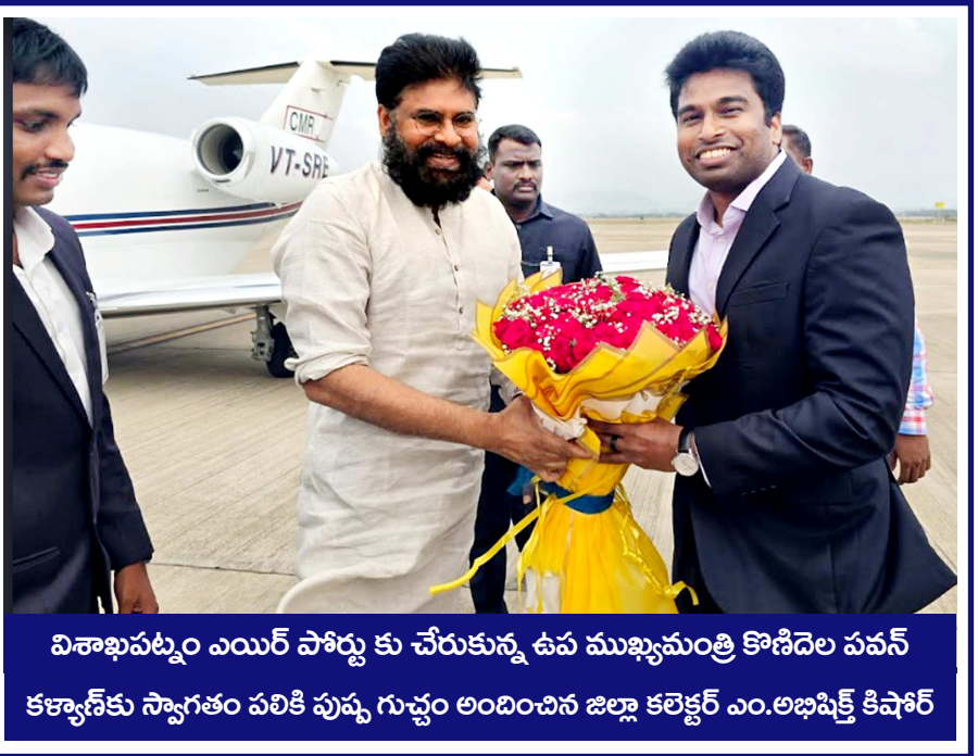
విశాఖపట్నం ఎయిర్ పోర్టు కు చేరుకున్న ఉప ముఖ్యమంత్రి కొణిదెల పవన్ కళ్యాణ్ కు స్వాగతం పలికి పుష్ప గుచ్ఛం అందించిన జిల్లా కలెక్టర్ ఎం.అభిషిక్త కిషోర్

సంపుటి : 21 సంచిక : 57 విశాఖపట్నం సంపాదకులు : కె.ఎస్.రంగశాయి గురువారం 09-04-2026 పేజీలు : 8 వెల : రూ.1-00