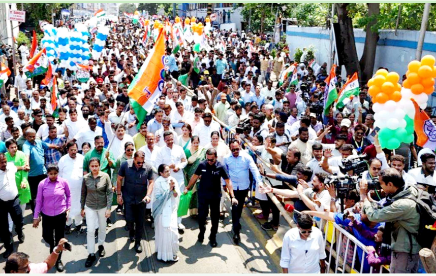
కోల్కతా, ఏప్రిల్ 08 : పశ్చిమ బెంగాల్ లో అసెంబ్లీ ఎన్నికల హడావుడి నెలకొంది. ఈ క్రమంలో రాష్ట్ర ముఖ్య మంత్రి మమతా బెనర్జీ తన సొంత నియోజకవర్గం భవానీ పుర్ నుంచి నామినేషన్ దాఖలు చేశారు. తన జీవితంలో అంతా ఇక్కడినుంచే మొదలైందని ఈ సందర్భంగా ఆమె వ్యాఖ్యానించారు. నామినేషన్ వేయడానికి ముందు ఖాళీఫోలోని నివాసం నుంచి అలిపూర్ సర్వే భవనం వరకు ఆమె రోడ్ డిపో

ఇప్పటికే ప్రజలు తీవ్రమైన ఇబ్బందులను ఎదుర్కొన్నారు. ప్రపంచ ఇంధన సరఫరా, వాణిజ్య నెట్వర్కులకు అంతరాయం కలిగింది. హార్మోన్ జలసంధి నుండి నిరాశంకమైన నౌకాయాన స్నేహం, ప్రపంచ వాణిజ్య ప్రవాహం కొనసాగుతుందని మేము ఆశిస్తున్నాము" అని తెలిపింది.