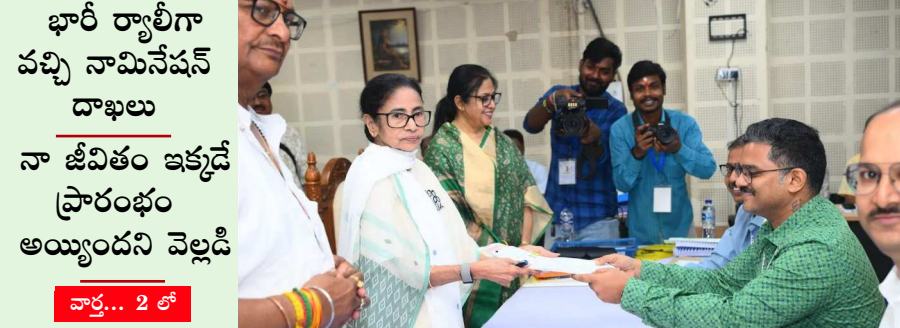
భారీ ర్యాల్లిగా వచ్చి నామినేషన్ దాఖలు నా జీవితం ఇక్కడే ప్రారంభం అయ్యిందని వెల్లడి వార్త... 2 లో