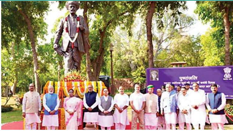
న్యూఢిల్లీ : సంఘ సంస్కర్త మహాత్మా జ్యోతిరావ్ పూలే 200వ జయంతి సందర్భంగా ప్రధాని మోడీ, రాష్ట్రపతి ద్రౌపది ముర్ములు నివాళులర్పించారు. శనివారం ఉదయం

రాష్ట్రపతి ద్రౌపది ముర్ము, ప్రధాని మోడీతో కలిసి పార్లమెంటు ప్రాంగణంలోని ప్రేరణా స్థల్ వద్ద మహాత్మా జ్యోతిరావ్ పూలే విగ్రహానికి పుష్పాంజలి ఘటించారు. ఈ నివాళి కార్యక్రమంలో లోక్ సభ స్పీకర్ ఓంబీర్లా, లోక్ సభ ప్రతిపక్షనేత రాహుల్ గాంధీ, కేంద్ర మంత్రులు అర్జున్ రామ్ మేహ్వాల్, జెపి నద్దా, మాజీ రాజ్యసభ డిప్యూటీ చైర్మన్ హరివంశ్ లు పాల్గొన్నారు. కాగా,