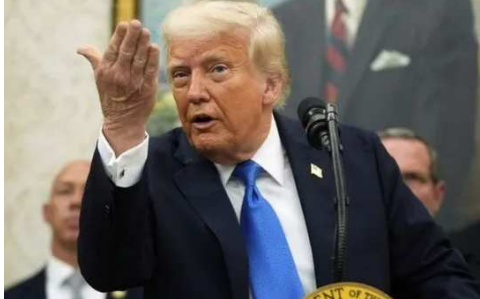
వాషింగ్టన్ : చోర్యుత్ జలసంధిని ఇరాన్ మూసివేయటంతో చమురు కోసం అనేక దేశాలు అమెరికాకు వస్తున్నాయని ఆ దేశాధ్యక్షుడు డోనాల్డ్