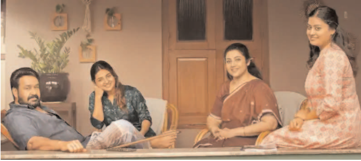
ఇండియన్ సినిమాలో ప్రాంచైజీ సినిమాల్లో మూడుకు మించి వచ్చిన దాఖలాలు తక్కువ. మన దగ్గర హిట్ సినిమాల సిక్వెల్స్ బాగా ఆదదం తక్కువే. ఒక సినిమా ఆడినా సరే.. మూడోది వచ్చేదంటే ప్రేక్షకులకు మొహం మొత్తేస్తుంది. ముందు సినిమా స్టూంటో కంటెంట్ ఉండదు. ప్రేక్షకులకు కూడా మొనాటనన్

ఫీలింగ్ వచ్చి రెండో సినిమాకో, మూడో సినిమాకో దండం పెట్టేస్తుంటారు. దీంతో అక్కడితో బ్రేక్ పడిపోతుంటుంది. ఐతే 'దృశ్యం' ప్రాంచైజీలో మాత్రం రెండో సినిమా అద్భుత స్పందన తెచ్చుకుని, మూడో చిత్రానికి దారిచింది. కానీ ఇటీవలే విడుదలైన 'దృశ్యం-3' మాత్రం కంటెంట్ పరంగా తీవ్రంగా నిరాశపరిచింది. ఈ సినిమా చూసిన ఏ ప్రేక్షకుడూ సంతృప్తి చెందలేదు. దృశ్యం-2 చిత్రాలకు ఇది దరదాపుల్లో కూడా లేదనే విషయంలో ఏకాభిప్రాయం వ్యక్తమైంది. కానీ సీక్వెల్ హైట్ వల్ల ఈ సినిమాకు వసూళ్లు విషయంలో మాత్రం ధోకా లేదు. టాకీతో సంబంధం లేకుండా భారీ ఓపెనింగ్ రాబట్టిన 'దృశ్యం-2'.. వీకెండ్ తర్వాత కూడా ఆగడం లేదు. ఓపెనింగ్ వెర్షన్ పెద్దగా వర్షపులే కాలేదు కానీ మలయాళ వెర్షన్ మాత్రం అన్ని చోట్లా బాగా ఆడుతోంది. కేరళలో అయితే వీక్ డేస్లో కూడా సినిమాకు హాస్ పుల్స్ పడుతున్నాయి. మోహన్ లాల్ స్టార్ పవర్కు తోడు దృశ్యం ప్రాంచైజీకి ఉన్న వాల్యూ బాకాఫీస్ దగ్గర అద్భుతాలు చేస్తోంది. విదేశాల్లో కూడా ఈ సినిమా బాగా ఆడుతోంది. విడుదలైన ఆరు రోజులకే ఈ చిత్రం రూ.200 కోట్ల గ్రాస్ వసూళ్లు మార్కును అందుకోవడం విశేషం. మలయాళంలో ఈ మార్కును అందుకున్న సినిమాలు పది కూడా లేవు. ఈ ఊపు చూస్తుంటే.. 'దృశ్యం-3' ఫుల్ రన్లో రూ.300 కోట్ల మార్కును కూడా అందుకుని, లోక పేటరు ఉన్న ఆల్ టైం హైయెస్ట్ గ్రాసర్ రికార్డును కూడా బద్దలు కొట్టే అవకాశాలు లేకపోవడం. ఈ చిత్రం ఇంత పెద్ద హిట్ అయిన నేపథ్యంలో 'దృశ్యం-4'కు రంగం సిద్దమైతే, మోహన్ లాల్, శేఖ జోసెఫ్ ఆ దిశగా టెంప్ట్ కాకుండా ఎలా ఉండగలరు?