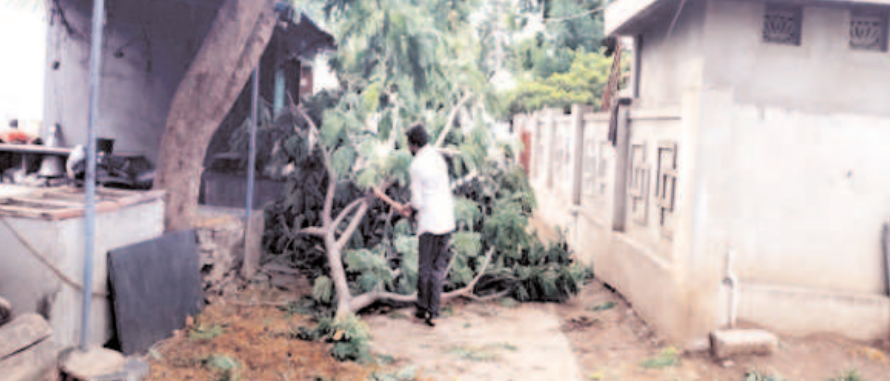
నేలకొరిగిన భారీ చెట్లు, విద్యుత్ స్తంభాలు - నిలిచిపోయిన విద్యుత్ సరఫరా

ముద్దనూరు, కడప, మే 29, నేటి మనదేశం : ఉరుములు, మెరుపులు భారీ ఈడుగులులతో కురిసిన వర్షం ధాటికి భారీ వృక్షాలు, కొమ్మలు నేలకొరిగాయి. వర్షం తక్కువ ఈడుగు గాలులు ఎక్కువగా వీయడంతో మండల వ్యాప్తంగా విద్యుత్ స్తంభాలు, చెట్లు, కొమ్మలు విరిగి పడ్డాయి. వందల ఏళ్ల నాటి చరిత్ర కలిగిన పెద్ద వేప చెట్లు సైతం కూలిపోయాయి. ఎన్నో ఏళ్లుగా ప్రయాణి కులకు నీడను ఇస్తున్న వేప చెట్లు వేర్వేరు సహా నేల కొరిగింది. ముద్దనూరు పాత బస్టాండ్ కూడలిలో, రైల్వే గేటు సమీపంలో, రైల్వే స్టేషన్ వెళ్లే దారిలో చెట్ల కొమ్మలు విరిగి రోడ్డుపై