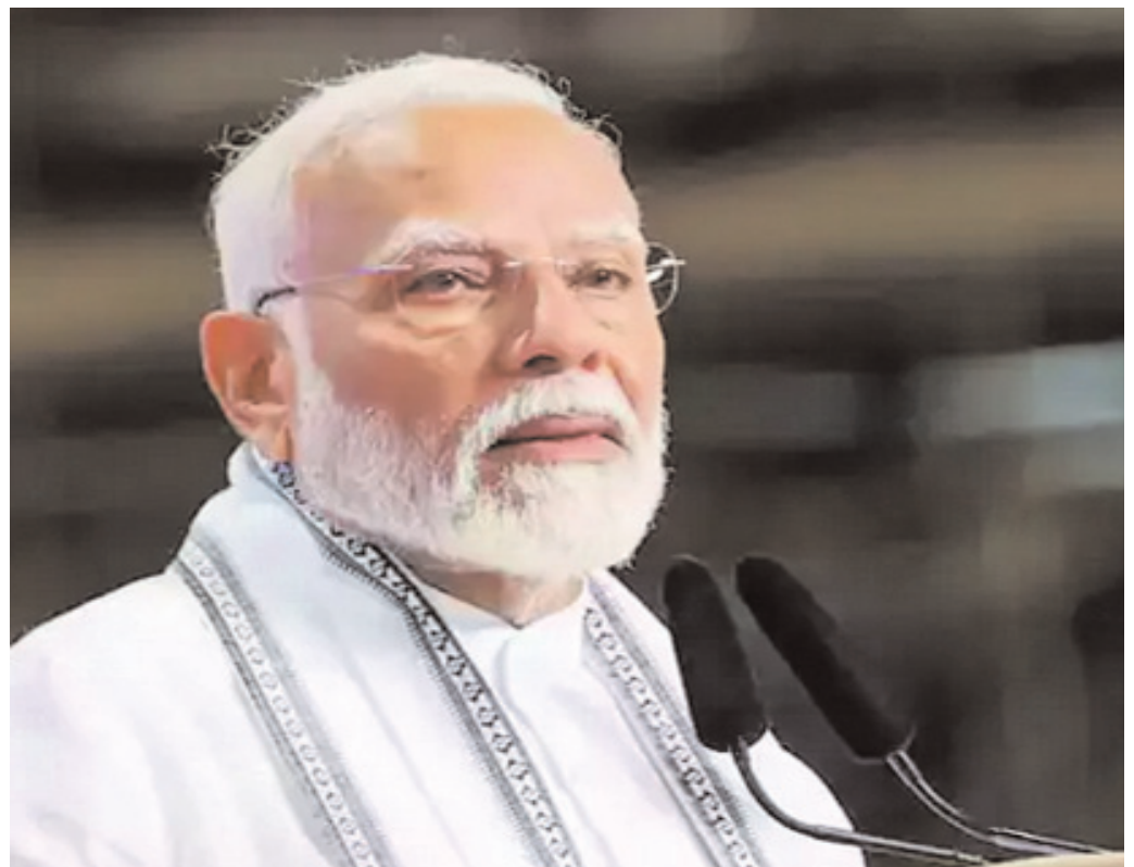
బయటకు వెళ్లాల్సి వస్తే తాగునీరు వెంట రక్షణ కోసం వాడే పానీయాలు మామిడి పండ్లు, మజ్జిగ, ఉండుకోవాలన్నారు. ఆయా రాష్ట్రాల్లో ఎండల నుంచి వర్షం, బేతపనా గురించి ప్రస్తావించారు.