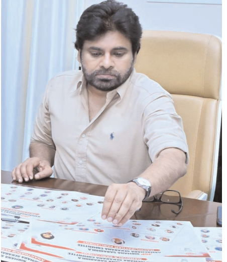
దేశభక్తి కలిగిన యువతను, చైతన్యవంతమైన నాయకులను మిగతా 2లో..

అమరావతి, జూన్ 4 (నేటి మనదేశం ప్రతినిధి): తన రాజకీయ ప్రయాణంలో యువత పాత్రను ప్రత్యేకంగా స్మరించుకుంటూ జనసేన అధినేత పవన్ కళ్యాణ్.. సామాజిక మాధ్యమం ఎక్స్ వేదికగా కీలక వ్యాఖ్యలు చేశారు. 2008లో 'ప్రజారాజ్యం పార్టీ(పీఆర్పీ)' యువజన విభాగం 'యువరాజ్యం' కోసం పటిష్టమైన యువజన విభాగం నిర్మించాలని ప్రణాళిక చేశానని తెలిపారు. జనసేన పార్టీని స్థాపించి 12 ఏళ్లలో ఎన్నో కష్టాలు, పోరాటాలను అధిగమించిన తర్వాత.. పార్టీ కార్యకర్తలు ఇప్పుడు అనుభవం, పరిణామాలతో నిండి, సంస్కారిత బాధ్యతలు చేపట్టడానికి, రాజకీయాల నిర్వహించడానికి, ప్రజా సమస్యలు పరిష్కరించడానికి సిద్ధంగా ఉన్నారని అన్నారు. ఈ సందర్భంగా తెలంగాణ యువరాజ్యం యువజన విభాగానికి పవన్ హృదయపూర్వక ధన్యవాదాలు తెలిపారు. 2005 నుంచి ఇప్పటి వరకు తనను విశ్వసించి అండగా నిలిచిన యువతకు పవన్ ప్రత్యేక ధన్యవాదాలు తెలిపారు. నిజాయితీ, నిబద్ధత,