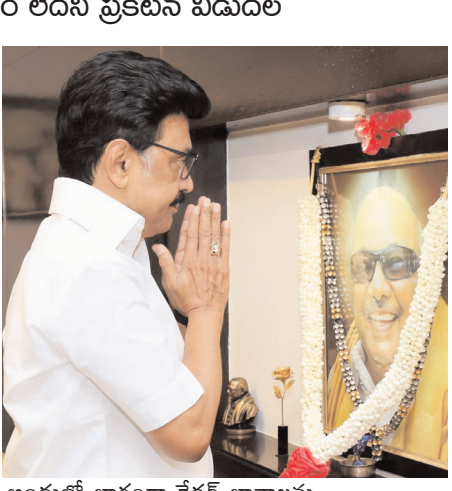
అందులో భాగంగా కేడర్ భావాలను మిగతా 2లో..

న్యూఢిల్లీ, జూన్ 4 (ఆర్ఎస్ఎ): అసెంబ్లీ ఎన్నికల ఫలితాల అనంతరం తమిళనాడులో చోటు చేసుకున్న రాజకీయ పరిణామాల నేపథ్యంలో ఇండియా కూటమికి బీటలు వారాయి. ఇందులో భాగస్వామి అయిన డీఎంకే కీలక నిర్ణయం తీసుకుంది. జూన్ 8వ తేదీన దేశ రాజధాని న్యూఢిల్లీలో జరిగే ఇండియా కూటమి సమావేశాన్ని బహిష్కరించాలని డీఎంకే నిర్ణయించింది. కాంగ్రెస్ పార్టీ పాల్గొనే ఈ భేటీకి వెళ్లే ప్రసక్తి లేదంటూ చెప్పేలోని డీఎంకే ప్రధాన కార్యాలయం గురువారం అధికారిక ప్రకటన విడుదల చేసింది. తమిళనాడు అసెంబ్లీ ఎన్నికల తర్వాత కాంగ్రెస్ పార్టీ తమకు తీవ్ర ప్రోహం చేసేదంటూ డీఎంకే సంచలన ఆరోపణలు చేసింది. కాంగ్రెస్ పార్టీ వెళ్తుంటే డీఎంకే కేబినెట్ తీవ్ర మనస్తాపం చెందాయని వివరించింది.