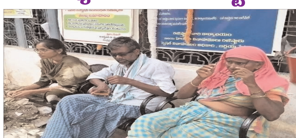
కలుగుతోంది. రిజిస్ట్రేషన్ కోసం దూర ప్రాంతాల నుంచి వచ్చిన ప్రజలు గంటల తరబడి వేచి ఉండాలి వస్తోందని, దీంతో సమయం, ధనం వృథా అవుతున్నాయని పలువురు వాపోతున్నారు. మరమ్మత్తుల పనులు వేగంగా పూర్తి చేసి విద్యుత్ సరఫరాను సాధారణ స్థితికి తీసుకురావాలని

సందిగామ జూన్ 05 (నేటి మనదేశం ప్రతినది) : జగ్గయ్యపేట పట్టణంలో కొనసాగుతున్న విద్యుత్ సమస్యలు ప్రజలను తీవ్ర ఇబ్బందులకు గురి చేస్తున్నాయి. దాదాపు పది రోజుల క్రితం కురిసిన గాలివాన కారణంగా పలు ప్రాంతాల్లో విద్యుత్ సరఫరా, తీగలు దెబ్బతిన్నాయి. వాటి మరమ్మత్తుల పనులు చేపడుతున్నామని విద్యుత్ శాఖ అధికారులు చెబుతున్నప్పటికీ, రోజూ గంటల తరబడి విద్యుత్ సరఫరాను నిలిపివేయడం ప్రజల్లో అసంతృప్తికి దారితీసింది. ఉదయం నుంచి సాయంత్రం వరకు వివిధ ప్రాంతాల్లో తరచూ విద్యుత్ కోతలు విధించడంతో గృహిణులు, వ్యాపారులు, విద్యార్థులు తీవ్ర ఇబ్బందులు పడుతున్నారు. ఎండ్ తీవ్రత ఎక్కువగా ఉన్న ఈ సమయంలో విద్యుత్ లేకపోవడంతో చిన్నారులు, వృద్ధులు మరంత అవస్థలు ఎదుర్కొంటున్నారు. వ్యాపార కార్యకలాపాలు కూడా ప్రభావితమవుతున్నాయని స్థానికులు ఆవేదన వ్యక్తం చేస్తున్నారు. విద్యుత్ కోతల ప్రభావం ప్రభుత్వ కార్యాలయాలపై కూడా పడుతోంది. ముఖ్యంగా సబ్-రిజిస్ట్రార్ కార్యాలయంలో విద్యుత్ సరఫరా నిలిచిపోవడంతో రిజిస్ట్రేషన్ ప్రక్రియకు అంతరాయం