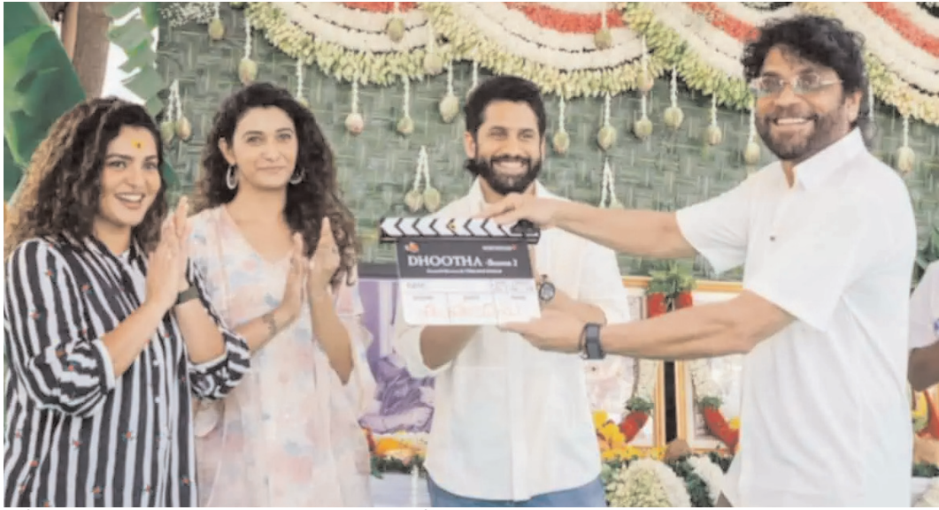
హీరోలు నిర్మాతలు కావడం కొత్తేమి కాదు. చిరంజీవి పీక్స్ లో ఉన్నప్పుడే అంజనా ప్రొడక్షన్స్ స్థాపించారు. కార్తీ నాగబాబు పేరు మీద కనిపించినా వెనుక ఉన్నది మోస్టాఫ్ నుండి ఓపెన్ సీక్రెట్. ఏఎన్ఆర్ ఉన్నప్పుడే తమ్ముడు అఖిల్. మామ వెంకటేశ్ తో పాటు రానా తదితరులంతా ఫ్యామిలీలోనే ఉన్నారు. సో లైన్స్ బాగా ప్లాన్ చేసుకోవచ్చు.