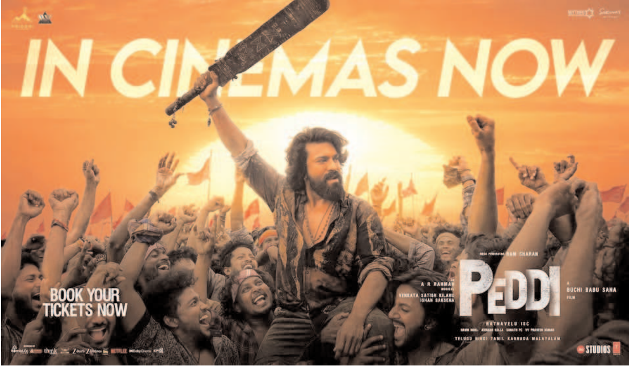
ప్రస్తుతం సోషల్ మీడియాలో 'పెద్ది' మేనియా కనిపిస్తోంది. భారీ సాంతం చేసుకుంది. రామ్ చరణ్ హీరోగా బుచ్చిబాబు దర్శకత్వంలో అంచనాల మధ్య విడుదలైన ఈ సినిమా వాటిని అందుకొని హిట్ టాక్ను తెరకెక్కిన ఈ సినిమా గురువారం ప్రేక్షకుల ముందుకువచ్చిన విషయం